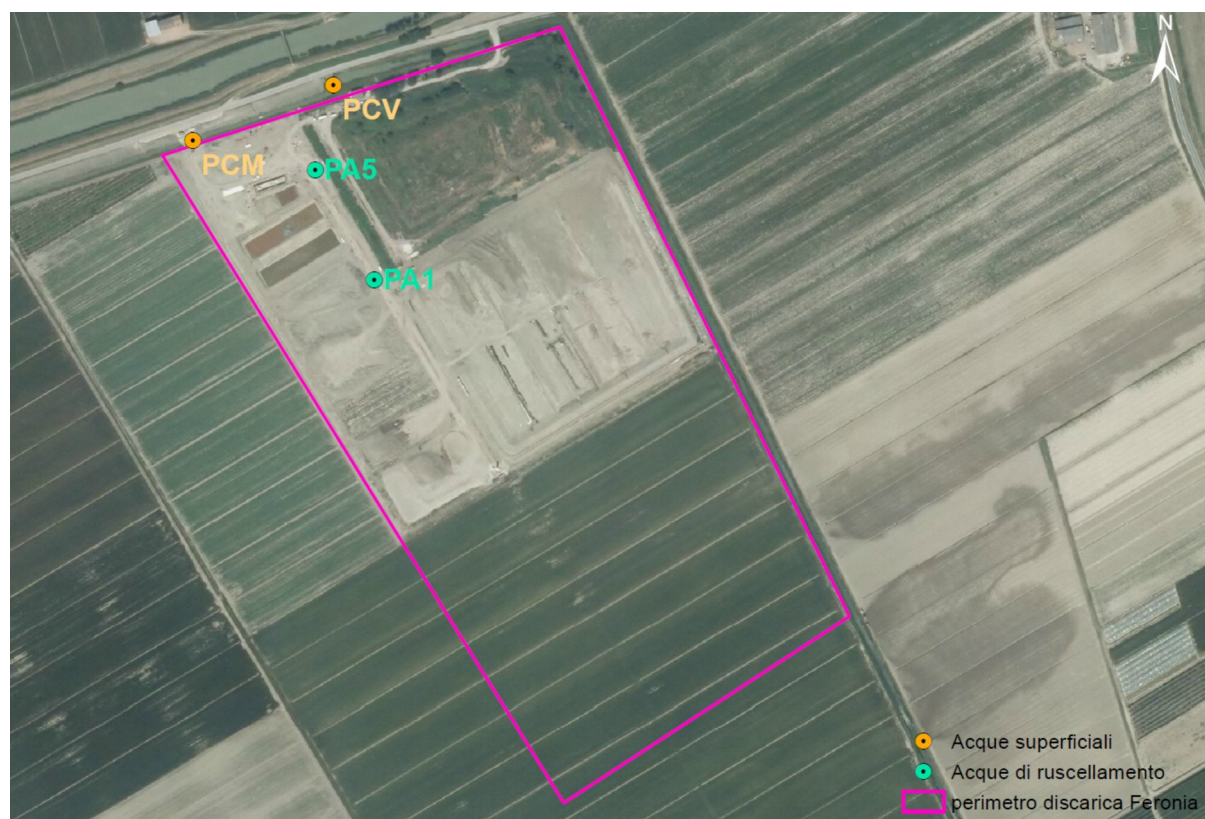
Figura 2 - Planimetria Discarica Feronia di Finale Emilia con rete di monitoraggio delle acque superficiali e meteoriche di ruscellamento.

Lo screening analitico da applicare al controllo delle acque superficiali e meteoriche di ruscellamento è riportato in Tabella 2.