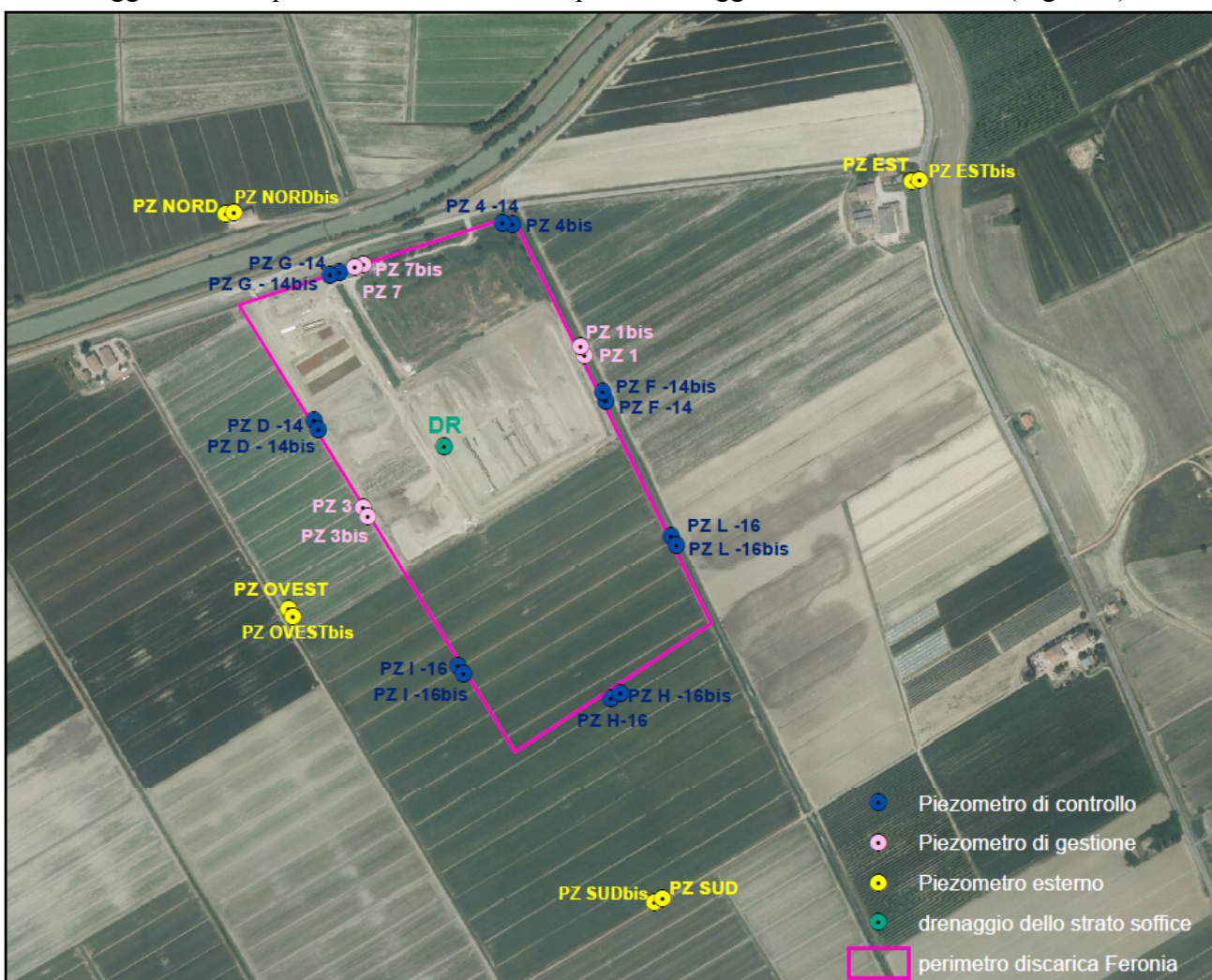
Figura 1 - Planimetria Discarica di Feronia di Finale Emilia con indicati i punti di controllo delle acque sotterranee dell'area impiantistica.

Di seguito, si riporta la cartografia relativa all'ubicazione dei piezometri costituenti la attuale rete di monitoraggio delle acque sotterranee e delle acque di drenaggio dello strato soffice (Figura 1).